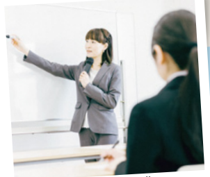
研修等、講師費用の助成を受けられます!