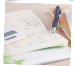
各種ローンの金利の優遇を受けられます!