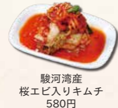
駿河湾産 桜エビ入りキムチ 580円