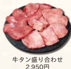
牛タン盛り合わせ 2,950円