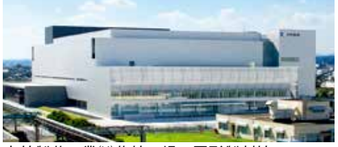
中外製薬工業(株)藤枝工場 固形製剤棟

錠剤やカプセルなどの医薬品は、2008年に新設した最先端技術・設備を有する固形製剤棟で、極わずかな量でも効果を発揮したり、細胞への作用が強い高活性医薬品が製造されており、廃棄物にはその成分が含まれていることが特徴です。 高活性廃棄物は、廃棄物分類のカテゴリーに