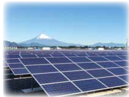
太陽光発電所（メガソーラーしみず）