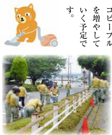
事業場周辺道路清掃

2014年4月に閣議決定された国の「エネルギー基本計画」は、「安全性を前提とした上でのエネルギーの安定供給」を第一とし、「低コストでのエネルギー供給と環境への適合の同時達成」を目標としています。弊社は、地域のみならずの安心・快適な暮らしをサポートするエネルギー事業者として、今後も引き続き、このエネルギー基本計画に則ったさまざまな活動を通じ、持続可能な社会の実現に向け努めてまいります。