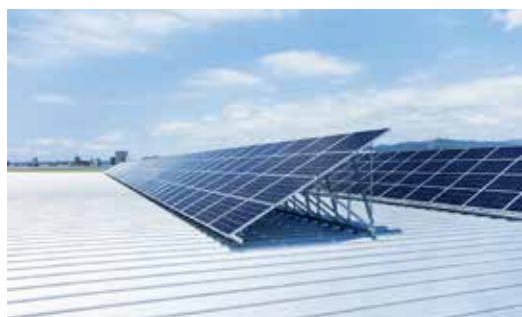
【太陽光発電システム】