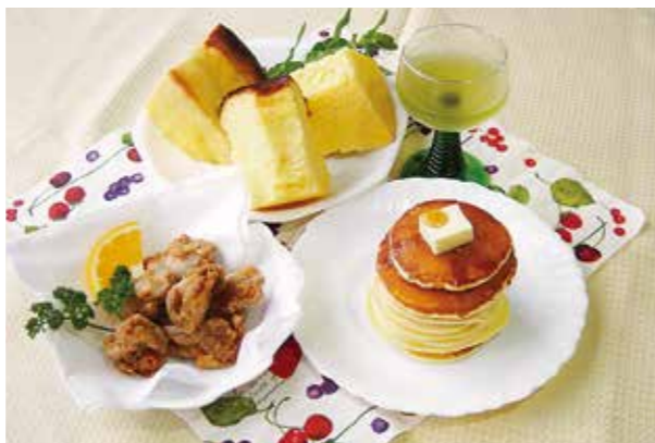
静岡県産米粉を使用したスイーツ等