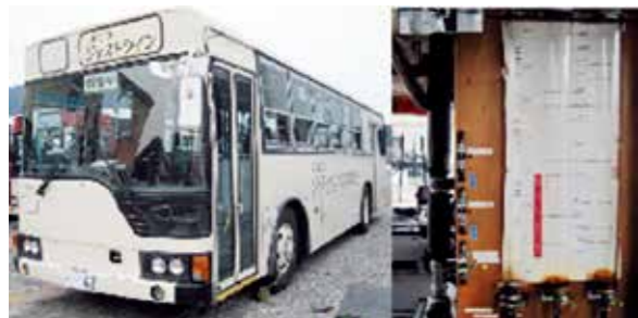
燃料消費計測システム（アナログ）を使用し新人教育に役立てている。

しずてつジャストラインの環境方針は2008年8月18日に決定し、公益事業者としての一般乗合旅客自動車運送事業（路線バス）および一般貸切旅客自動車運送事業（貸切バス）を通じ地球温暖化防止のため環境保全活動に取り組み、高品質なサービス提供と安全な運行により地域に貢献し、企業活動と自然環境調和を目指し社会を果たすとし始めました。 もともと2005年5月にはエコ活動として「少しでも環境問題が改善できれば」との思いで活動して来ましたが、翌年環境行動計画を立て、全従業員に対し環境に関する一般的な情報を伝え、環境意識の向上を図りました。