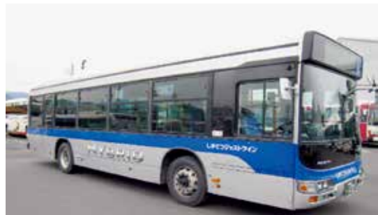
2011年1月28日ハイブリットバスを採用