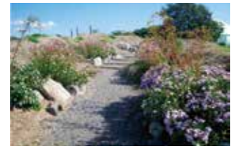
ビオトープ彩の丘

このコーナーでは、『環境』をキーワードに様々な取り組みを行っている方々にスポットをあて紹介します。