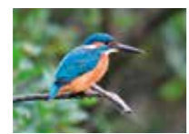
ビオトープ内で撮影したカワセミ