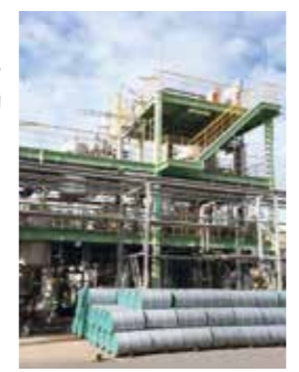
フェノール樹脂リサイクルケミカルリサイクル実証プラント

リサイクル (フェノール樹脂リサイクル、洗浄溶剤の再生等) をしています。廃棄物は更に削減を目指しています。量だけでなく、費用削減、発生原因の排除に取り組んでいます。 (2) 省エネ活動 2010年から、外部コンサルタント指導のもと、省エネプロジェクトチーム (5年間で8チーム) を結成して活動しています。活動内容は①コージェネボイラの熱損失改善、②嫌気性汚泥装置導入でエネルギー効率改善、③水銀灯LED化等です。