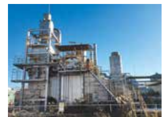
コージェネボイラ

は11%削減、CO 2 削減換算「5千t/年」の成果を上げています。 (3) 環境に配慮した製品の開発 自動車部品の成形材料は、従来の金属製部品を樹脂製に替えて軽量化を図り、燃費向上に貢献しています。また、プリント配線板用の積層板ではハロゲン化原料を使用しない製品開発や鉛フリー半田への対応を行っています。フェノール樹脂は未反応原料 (例:ホルムアルデヒド) が少ない製品開発を進めています。 (4) 地域社会への貢献 静岡県産廃協会の不法投棄キャンペーンに参加、藤枝市環境保全協議会では瀬戸川の河川清掃に協力を行っています。また地域の福祉施設「南部すみれの家」と交流し、工場緑化の一環として花のプランターを購入入しています。 (5) ビオトープ造成 志太地域の生物多様性保全に貢献